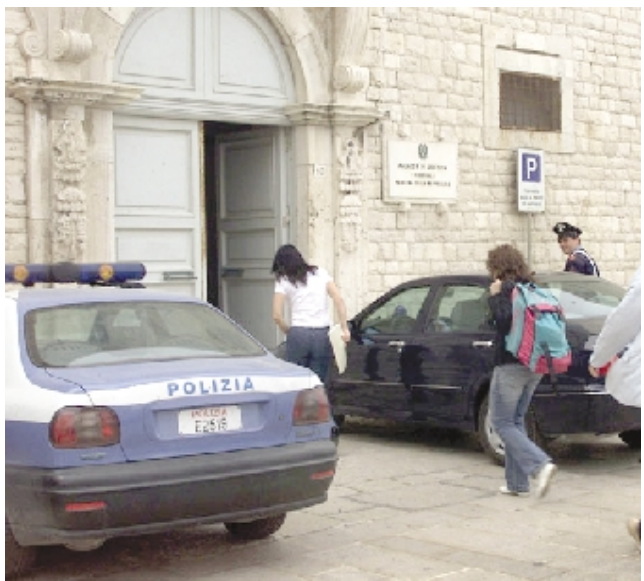
Il tribunale

Trani sede di facoltà universitaria: dopo l'ipotesi di istituirne una in materia di Turismo ora si prospetta la sede distaccata di Giurisprudenza