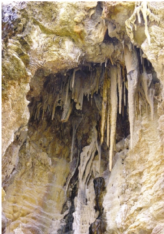
Due significative immagini delle grotte recentemente scoperte nel territorio di Minervino Murge

● Dopo il sequestro della cava abusiva, nel maggio scorso, gli speleologi si sono calati nel cunicolo e, come era stato ampiamente previsto, sono stati individuati alcuni antri, a una profondità di ottanta metri, di una bellezza unica