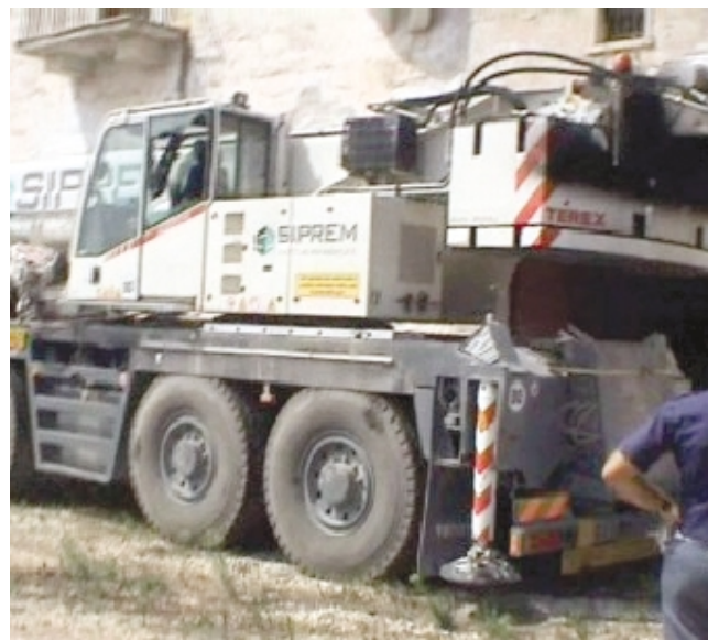
Uno degli automezzi rinvenuti dalla Polizia

Secondo gli investigatori i veicoli erano stati nascosti in attesa, forse, di essere restituiti dietro pagamento del classico «cavallo di ritorno»